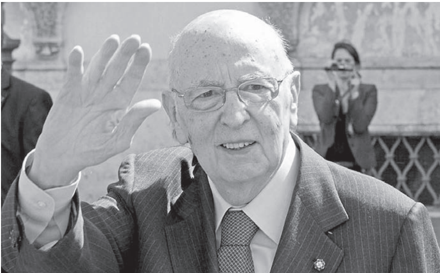
A 89 ans réélu Président de l'Etat italien: Giorgio Napolitano