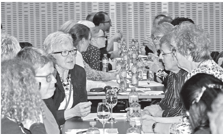
Participants dans une discussion animée

Comme tâches de planification pour les villes, il recommanda notamment la création de locaux sociaux comme lieux de rencontre pour tous les groupes d'âge et de population, des offres d'assistance financièrement supportables pour tous, la promo-