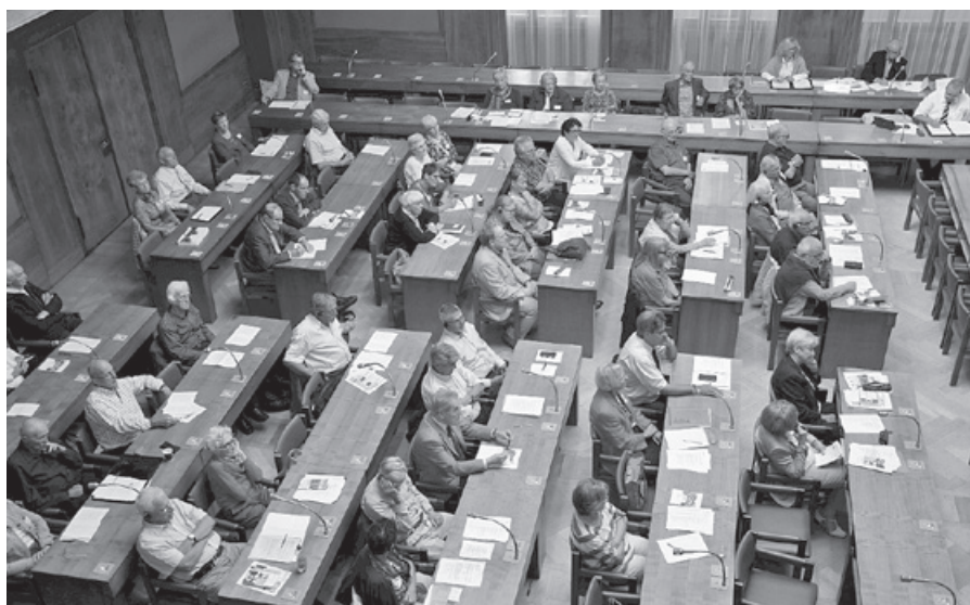
Vue aérienne d'auditeurs concentrés dans la salle du Grand conseil valaisan.

Outre une Assemblée extraordinaire des délégués, le CSA tint à Sion une journée de travail sur le thème de la «Politique de la vieillesse en Suisse». Une des principales conclusions de la manifestation est que les seniors doivent davantage participer à la solution des questions actuelles.